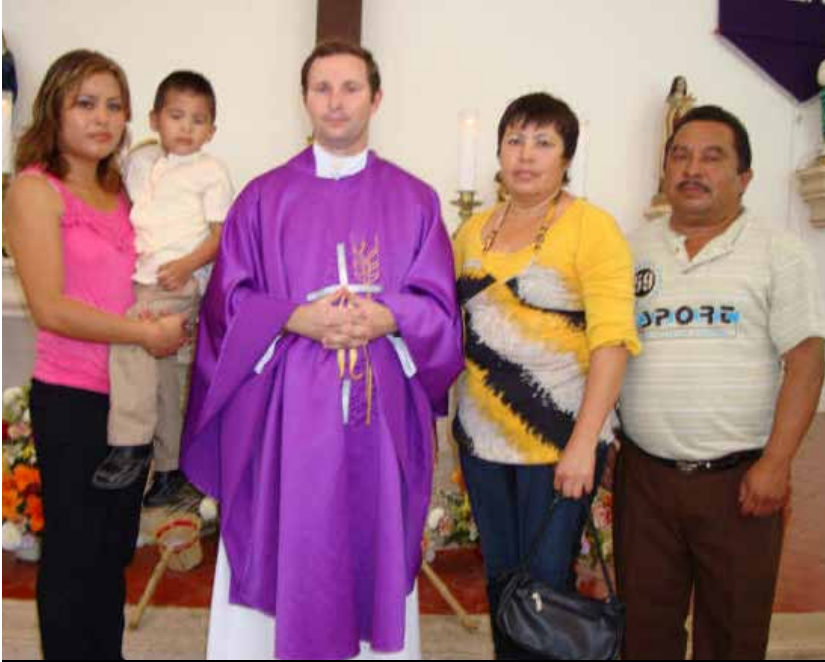
Cumpliendo 3 años